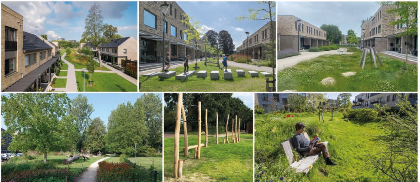
GROENSTROOK - REFERENTIES